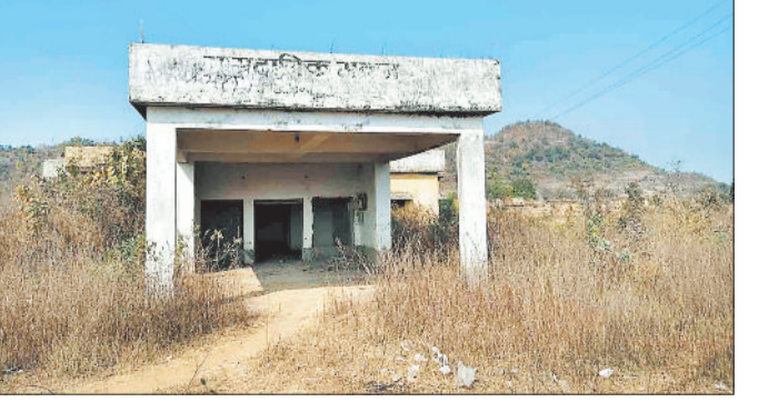
जर्जर सामुदायिक भवन।

शासन प्रशासन द्वारा गांव के विकास के लिए कई विभिन्न योजनाएँ संचालित की जा रही हैं। योजनाओं को लाभ न सिर्फ ग्रामीणों को मिल रहा है बल्कि गांव का विकास भी हो रहा है। ग्रामीणों को किसी सार्वजनिक कार्यक्रम या शादी विवाह जैसी कार्यक्रम में किसी प्रकार की परेशानी न हो इसे ध्यान में रख ग्राम पंचायतों में एक सामुदायिक भवन का निर्माण कराया गया है जिसका लाभ ग्रामीणों को मिल रहा है।